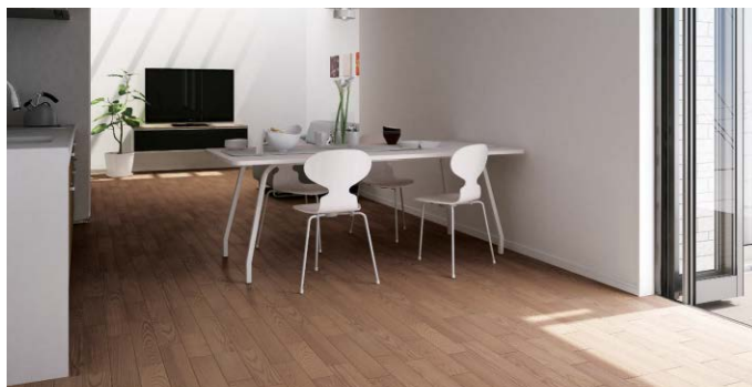
床材：ジオラスタンダード〈トープグレー色〉

●写真はあくまでイメージです。天然木のため、床材1枚の中でも材色の影響による色の濃淡が出ます。